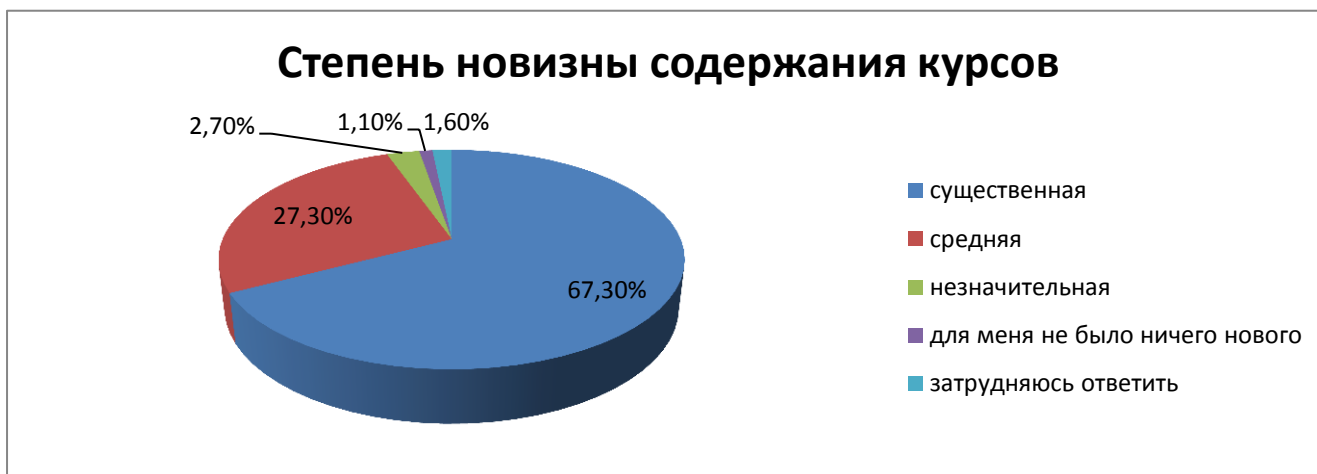
Диаграмма 1. Степень новизны содержания курсов.

Достаточно высоко оценивается участниками исследования новизна содержания курсов (диаграмма 1).