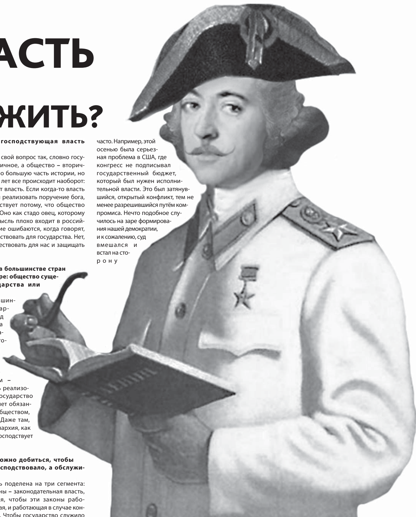
Коллаж: Анастасия Поснова

часто. Например, этой осенью была серьезная проблема в США, где конгресс не подписывал государственный бюджет, который был нужен исполнительной власти. Это был затянувшийся, открытый конфликт, тем не менее разрешившийся путём компромисса. Нечто подобное случилось на заре формирования нашей демократии, и к сожалению, суд вмешался и встал на сторону