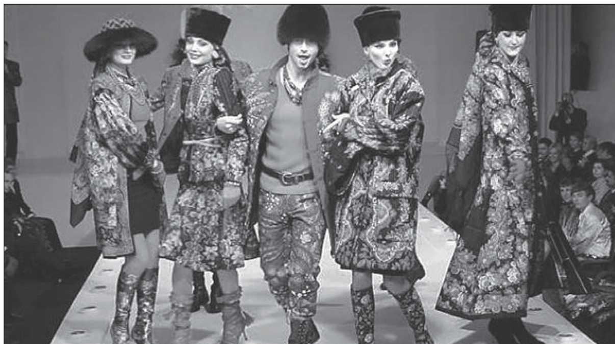
Фотография с показа Вячеслава Зайцева