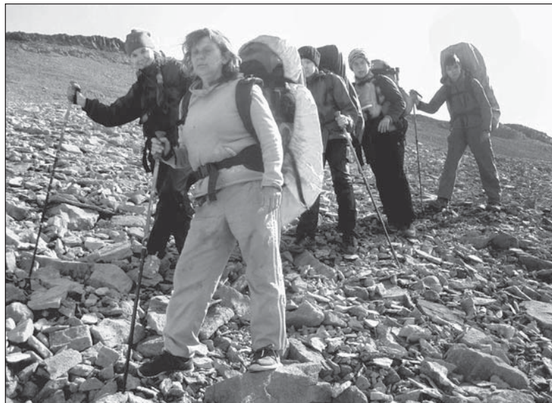
Фото из архива клуба