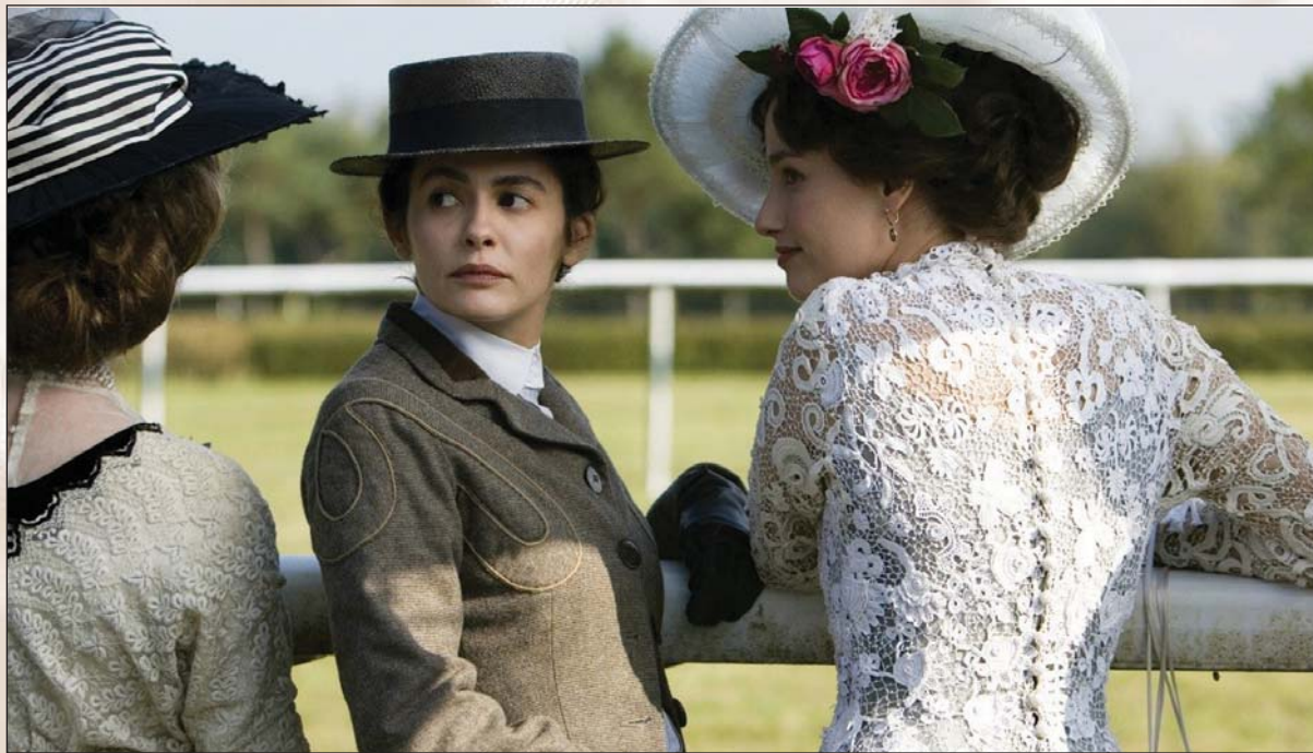
Кадр из фильма «Коко до Шанель»

Она сняла с женщин корсет, подарила им черный цвет и подстригла волосы, создавая неповторимый стиль безупречных линий и идеальных пропорций. Шанель никогда не любила огромные шляпы, напоминающие брызги, тугие корсеты, платья, расшитые кружевами и рюшами, и массивные драгоценности. Шанель первой появилась в светском обществе Парижа в строгом клетчатом платье с белым воротничком и в миниатюрной черной шляпке. Фильм «Коко до Шанель» — история нелегкого пути к известности и славе великой женщины, рассказ о ее первых шагах в качестве модного кутюрье.