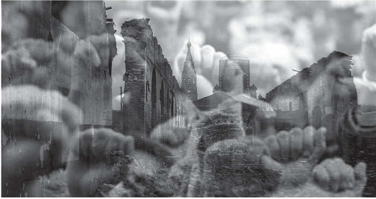
Коллаж: Анна Разумова

26 августа 2012 года в Щербаковом переулке был снесен дом купца Рогова – один из немногих дошедших до наших дней образцов застройки Петербурга начала XIX века. За его спасение градозащитники боролись несколько лет. К сожалению, это не первый случай, когда городские власти не считаются с мнением общественности и позволяют сносить исторически значимые здания. В качестве примера можно привести дом купца Лопатина, больше известный как Литературный дом или же пакгауз Варшавского вокзала.