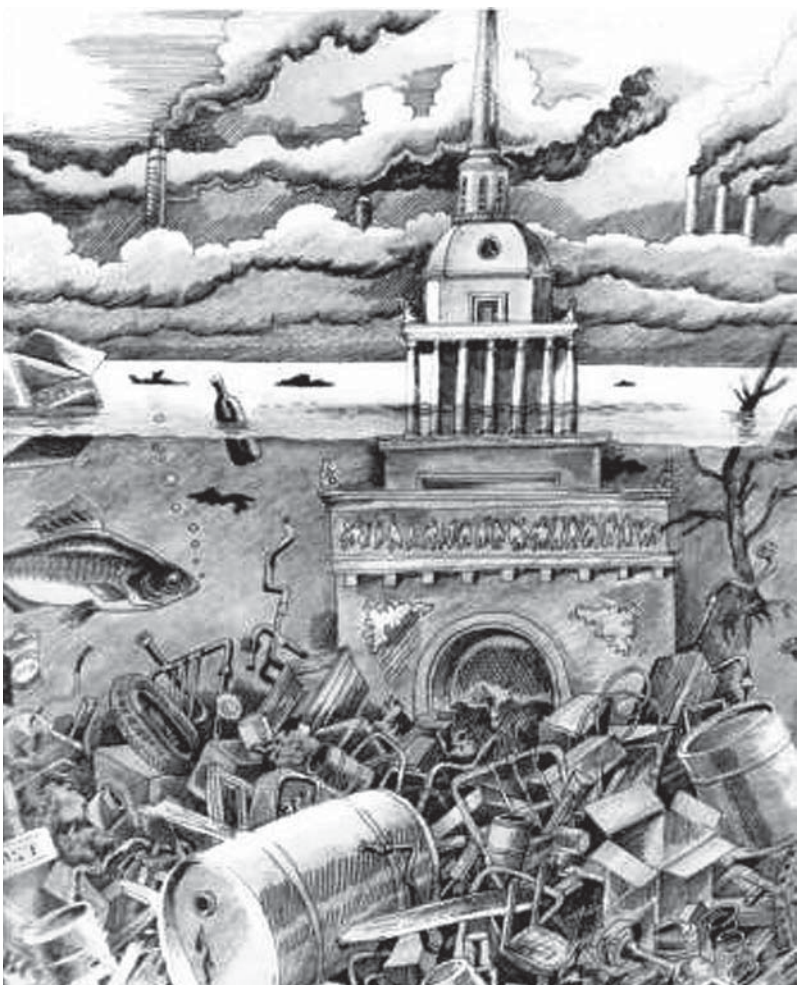
Иллюстрация: Виталий Танасийчук

Город Рыбинск, Ярославская область. Семьсот километров от Петербурга, восемь часов езды на поезде. Население – 240 тысяч человек. Дымом из труб судостроительного завода вьется там лениво, а пробок не бывает даже на