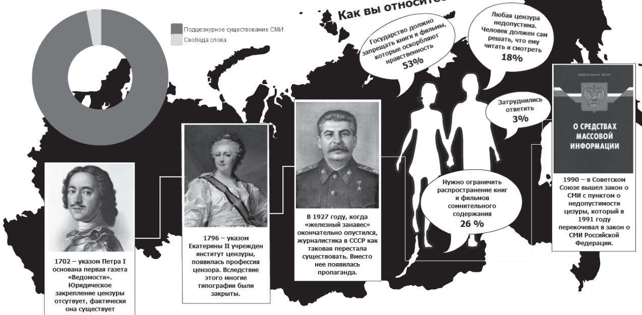
Инфографика: Варвара Крюк

За все 311 лет существования печатных СМИ в России, если складывать все этапы нашей истории по отдельности, в сумме получается, что всего 9 лет была юридическая свобода слова. В остальное же время существовала либо предварительная, либо карательная цензура.