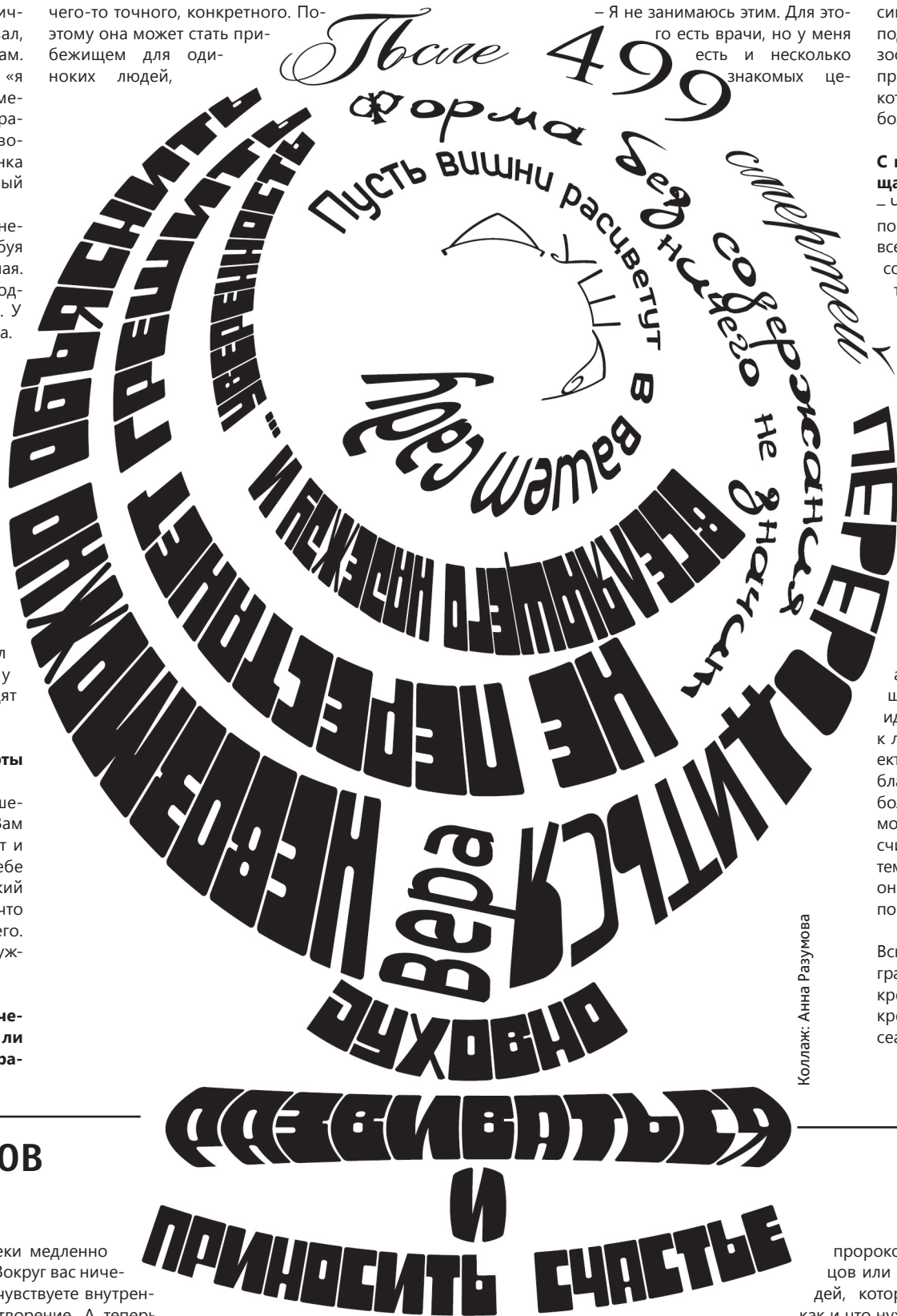
Коллаж: Анна Разумова