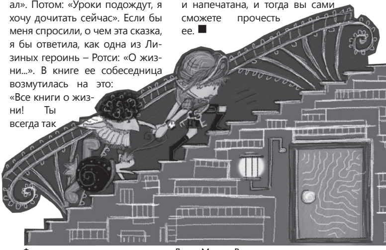
Фрагмент иллюстрации из книги Лизы-Марии Вастерхоут

говоришь! Ну... ну расскажи хотя бы вкратце, хотя бы самую суть!». Так вот вкратце книга Лизы состоит из ста страниц и столько же невероятных картинок. Как я ни старалась, я не смогла найти схожести ни с одним известным мне произведением. В сказке юной писательницы главная героиня живет в небе на облаках, и с ней случаются самые разные приключения. Там есть и подвиги, и дружба, и проказы, но мне особенно запомнились детали: от описаний одежды до примет и устоев этого сказочного мира. Например, всем «облачаткам» известно, что если из облака капает вода, значит, оно больше не сможет выдерживать ни домики, ни их жителей, и совсем скоро растворится. Все остальное мне не хочется подгонять ни под один штамп вроде «Эта книга учит, что такое хорошо, а что такое плохо, воспитывает ребенка». Я надеюсь, скоро «Лимидария» будет дописана и напечатана, и тогда вы сами сможете прочесть ее. ■